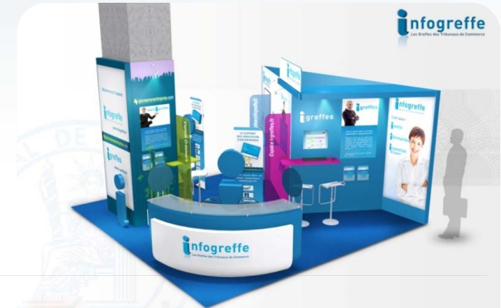
Stand Infogrefe, n°126, 25m 2 Salon des Entrepreneurs de Paris, du 3 au 4 Février 2010